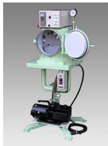
16ZD外観 (オプション付き写真)