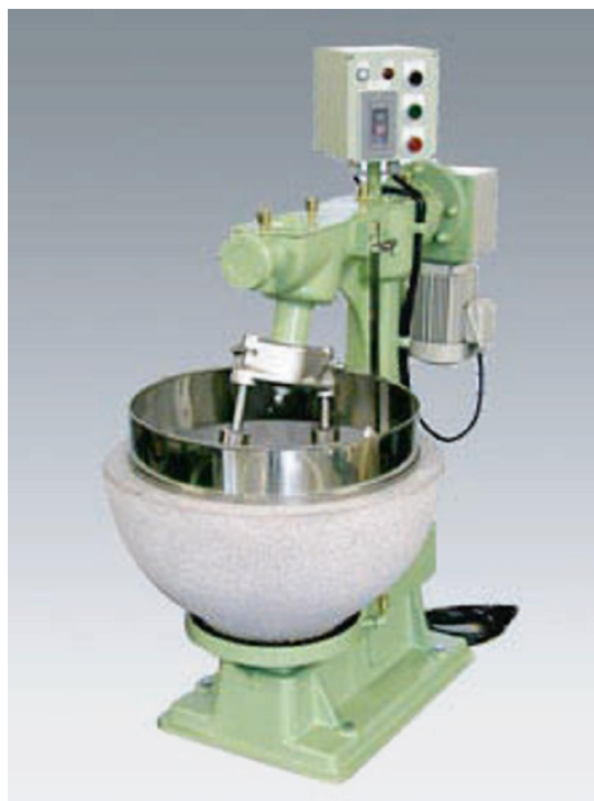
▲そば第2号仕様機(花崗石臼鉢・木杵)

ISHIKAWAの攪拌播潰機は、「攪拌」「播り潰し」「混合」「練り合せ」を同時に行うことが出来る、世界で唯一の機械です。独自の基本構造で、密度の高い粒径均一性、混合均一性を実現し、製品の品質向上に貢献します。作業時間の短縮や、省力化などにもつながると、数多くのお客様にご好評頂いております。