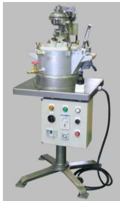
▲第18号電熱湯煎型 (モータ直結式) ※写真はオプション付 (インバータ、タイマー)