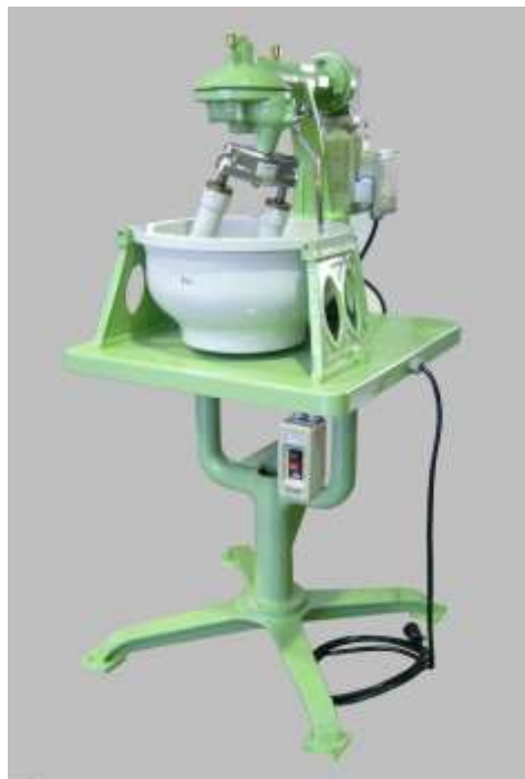
▲第24号縦型（モータ直結式） 背面のベルトカバーがなくスッキリ。