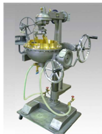
特殊24R号外觀 (オプション付き写真)